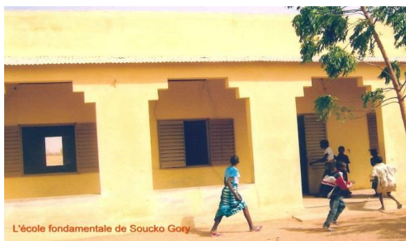
L'école fondamentale de Soucko Gory