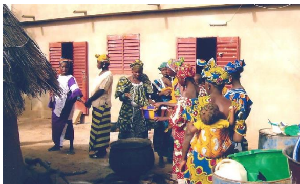
Un groupe de femmes se partage de l'eau potable

Les quatre photos ci-dessous du village de Soucko-Gory qui illustrent cet article ont été fournies aimablement par Monsieur Boubacar Camara migrant de ce village.